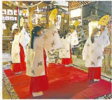
神楽 郡山八幡神社

第43代 女王卑弥呼の3人が、お客様と一緒に城下町の三社を巡り椿の花を奉納、神社のご由緒を紹介します。郡山八幡神社では神楽の奉納があり、薬園八幡神社では参加者全員の無病息災を祈願してお祓いをしていただきます。webサイトで参加受付(定員20人・無料)、申込多数の場合は抽選。