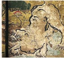
唐獅子図 薬園八幡神社