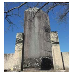
柳泽保申伯颂德碑 (功德碑)