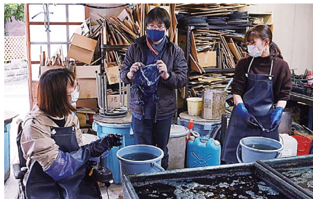
反复拧干、蓝染→水洗

其中之一“触蓝工房 绵元”是在1989年复活了大和郡山蓝染历史的工房。该工房研究当地气候和水质,并追求日本传统的蓝染之美。体验项目丰富多彩,既有两个小时左右即可完成带走的手帕蓝染,也有面向高阶人士的花瓣染(工房独有的夹缬技法),可以体验到各种蓝染技法及草木染(每次最多40人)。近年来也有国外游客前来体验。另外,“触蓝工房 绵元”的一大特征,便是也向希望使用传统蓝染的外部作家和企业家敞开了大门。