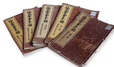
福寿堂年录 (柳泽吉里官方日记) 奈良县指定文化财产