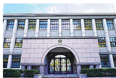
位于郡山城遗址二之丸遗址的奈良县立郡山高中