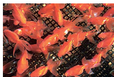
金鱼是大和郡山的标志，每年约出货5,800万条金鱼。

柳泽家从柳泽吉里的父亲—柳泽吉保的时代开始就十分重视文化教育，柳泽保申也为创建奈良县寻常中学（今天的奈良县立郡山高中）而竭尽全力。