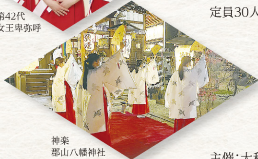
神楽 郡山八幡神社